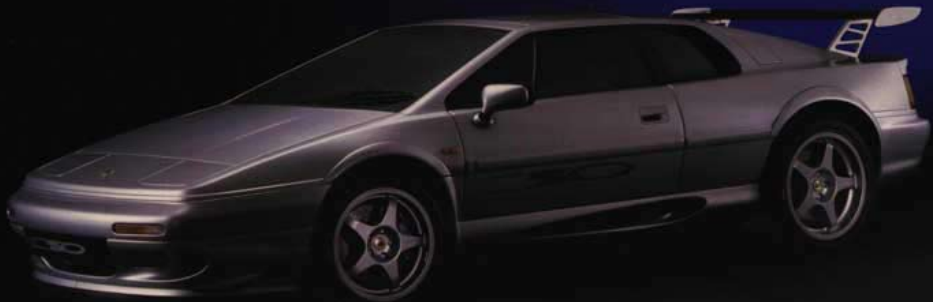
Lotus Esprit V8 Sport 350